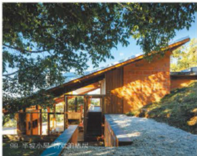
098 半坡小屋：诗意的栖居