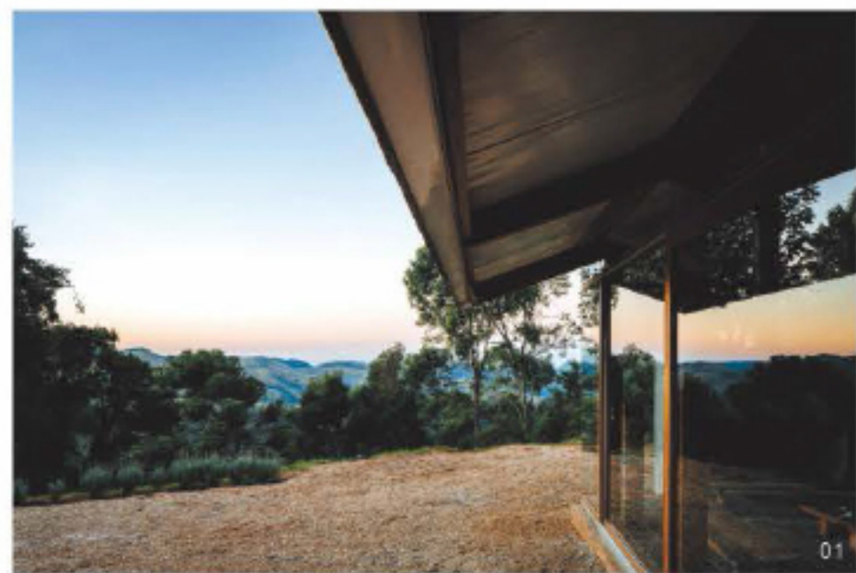
02. 房屋选用的主色调与墙面的赤陶色类同, 十分温暖亲和